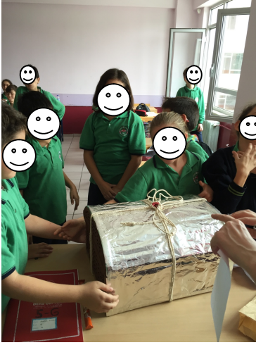
Fotoğraf 4. Öğrenciler Zaman Kapsülünü Saklanacağı Yere Götürürken