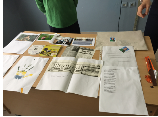
Fotoğraf 6. Öğrencilerin Zaman Kapsülünden Çıkan Zarflarını Açması ve Değerlendirmesi

içinden çıkanlar, gördükleri ve hissettikleri hakkında sınıfa bilgi vermeleri istenmiştir. Örneğin bir öğrenci “geçen yıl çok sevdiğim bu oyuncacı artık o kadar da sevmiyorum, el izime bakınca ne kadar da büyümüşüm, fındık fiyatı ne kadar düşmüş, dolar fiyatı ne kadar yükselmiş” gibi ifadelerle zarfını yorumlamıştır.