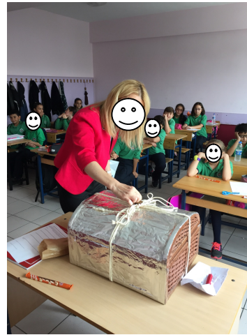
Fotoğraf 3. Araştırmacı Tarafından Zaman Kapsülünün Kapatılması (Mühürlenmesi)

Öğrenciler kapattıkları zarfları sırayla zaman kapsülüne yerleştirmişlerdir. Öğrenci materyalleri yerleştirilen dışı jelatin kaplı ve sandıktan hazırlanmış olan zaman kapsülü, sağlam bir ip ile sarılarak bağlanmıştır. Zaman kapsülünün başkası tarafından açılmasının önüne geçmek ve tarihi bağlantı kurmak amacıyla ipin düğüm noktasına mum eritilip damlatılmış ve mühür basılarak kapatılmıştır. Böylece öğrencilerde kapsülün onlardan habersiz açılmayacağı izlenimi oluşturulmaya çalışılmıştır.