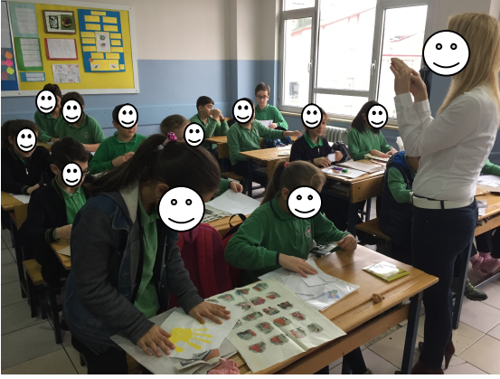
Fotoğraf 8. Etkinliğin Sonuçları ve Kazanımları Hakkında Paylaşım