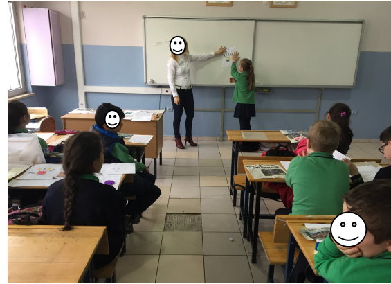
Fotoğraf 7. Zaman Kapsülünden Çıkanların Sınıfta Değerlendirilmesi

Zaman içerisinde gerçekleşen değişimin öğrenciler tarafından fark edilmesini kolaylaştırmak amacıyla araştırmacı sınıfta bazı materyallerle ilgili paylaşımlarda bulunmuştur.